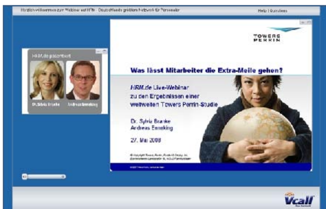
Abb. 2: Ansicht des Webinars für Teilnehmer