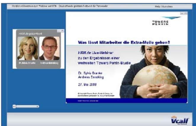
Abb. 2: Ansicht des Webinars für Teilnehmer